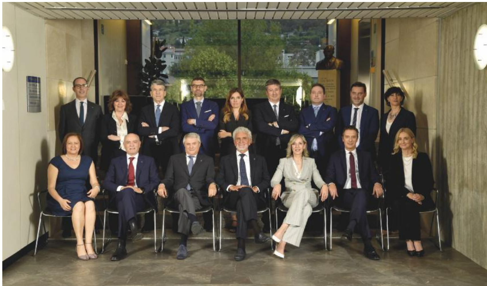
Il Consiglio di amministrazione, il Collegio sindacale e la direzione della banca di credito cooperativo con quartier generale a Nave

A rafforzare il quadro complessivo contribuisce una struttura patrimoniale di assoluta solidità. Il patrimonio netto supera i 490 milioni di euro, mentre il principale indicatore di stabilità, il