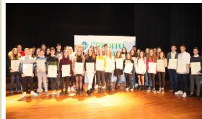
Anche quest'anno un grande applauso per gli studenti meritevoli

Agli studenti un applauso e un totale di 75.200 euro «per premiare l'impegno»